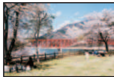
草木湖 ダム直下さくらライトアップ4月中旬頃から