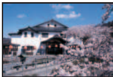
ながめ公園 さくらライトアップ4月上旬頃から