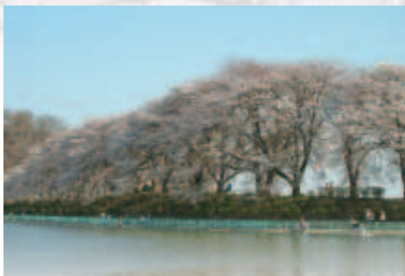
鹿の川沼 さくらライトアップ 4月上旬頃から